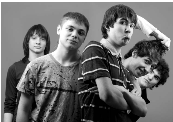
Der No Blame Approach -Ansatz bezieht die mobbenden Schüler in die Problemlösung mit ein.

Im Rahmen des gesamten Vorgehens ist es wichtig, dass die Lehrperson niemandem Schuld zuweist. Die Mitglieder der Unterstützungsgruppe werden angesprochen als Helferexperten. „Ich habe Euch angesprochen, weil ich überzeugt bin, dass Ihr mir helfen könnt, die Situation für X zu verbessern.“ Bei gegenseitigen Vorwürfen und Schuldzuweisungen helfen Äußerungen wie: